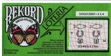
Przykłady zdrapek Polskiego Monopulu Loteryjnego