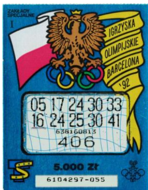
Przykład zdrapek Totalizatora Sportowego