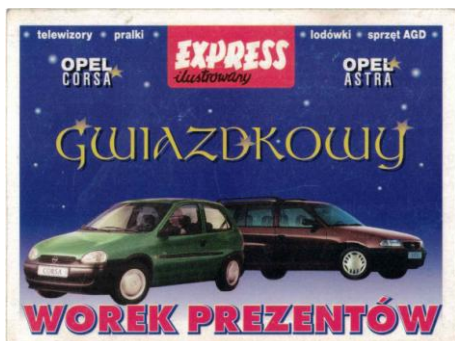
Przykład zdrapek z gazety Ekspres Ilustrowany